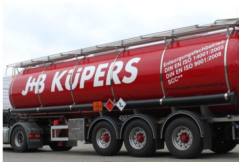
Camion-citerne, J+B Küpers GmbH

J+B Küpers GmbH cherchait une solution pour charger et décharger ses camions-citernes pour des applications pétrochimiques. Dans ce genre d'applications, les pompes doivent satisfaire un certain nombre d'exigences, en termes de dimensions et de poids notamment, pour pouvoir être montées sur une citerne sans occuper trop de place ou peser trop lourd. Elles doivent être polyvalentes et résistantes aux produits chimiques pour pomper différents liquides, dont certains très visqueux. Un autre paramètre très important est l'inversion du sens d'écoulement qui permet de procéder au chargement et au déchargement du véhicule au moyen d'une seule pompe.