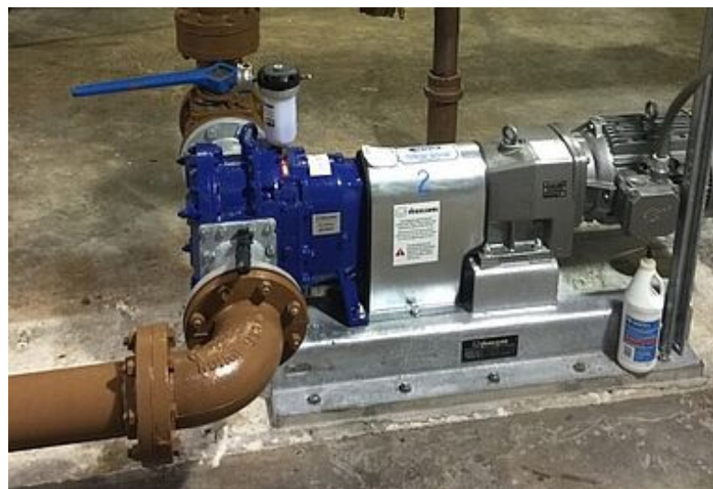
Pompe à lobes VX136-105Q de Vogelsang

La station d'épuration de Penn Township Hanover, en Pennsylvanie, possédait des pompes à vis excentrée qui ne fonctionnaient plus efficacement. Les opérateurs ont cherché une solution de remplacement rentable et plus facile à entretenir. Avant l'installation des pompes à lobes Vogelsang VX136-105Q, l'utilisateur final avait des difficultés à maintenir le débit. Par conséquent, l'usine devait faire fonctionner les deux pompes PC en même temps, 5 jours par semaine, afin de répondre à la demande.