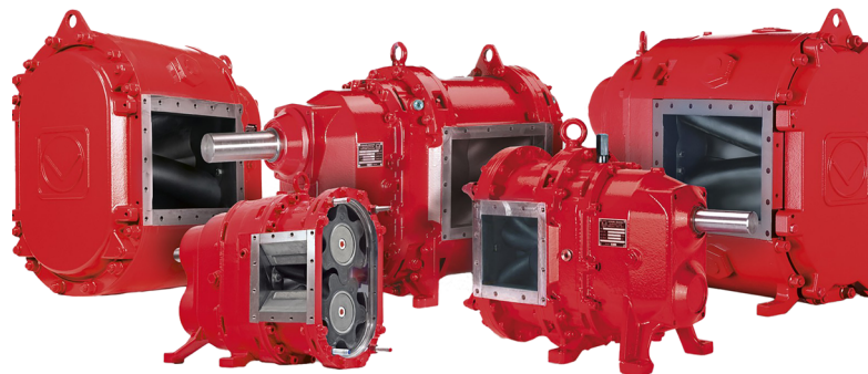
Vogelsang VX serien

QuickService designet var en afgørende fordel. Service og vedligehold kan udføres direkte på stedet uden afmontering af pumpen, hvilket reducerer nedetid og sikrer en mere omkostningseffektiv drift.